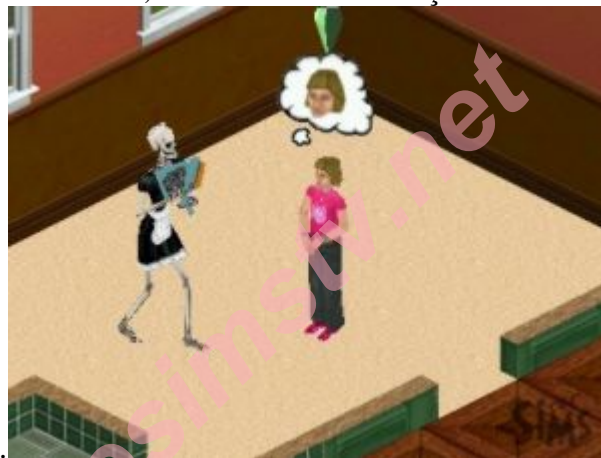
de seu proprio nariz...