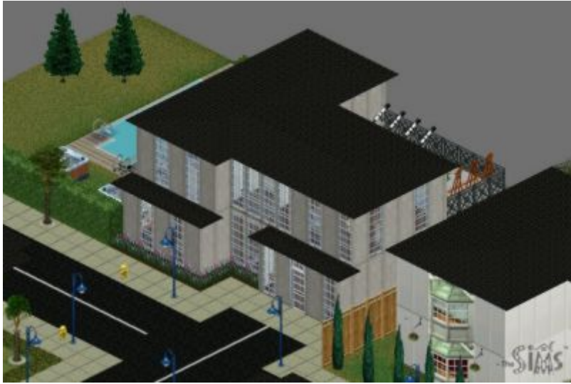
Cidade Cenográfica (Faculdade e Casa de Suzan)