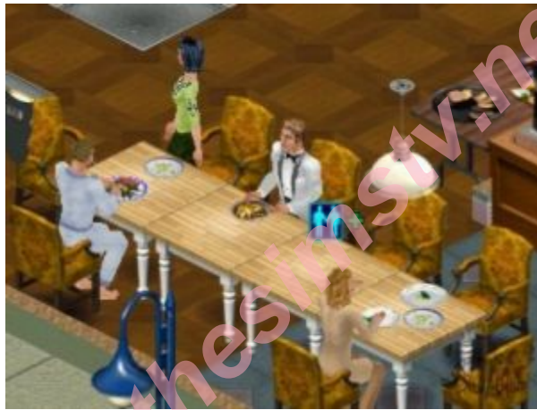
Elenco batendo um rango