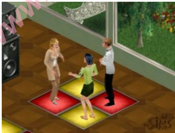
Festa após o último dia de gravação